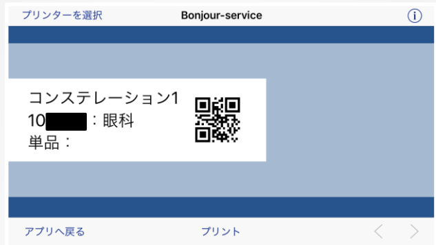
【シールプレビュー】