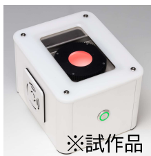
※試作品 高分解能型