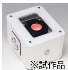
※試作品 高分解能型